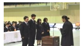
トータルナーシングサービス チーム(1年4組)