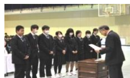
千代島自動車整備工場 チーム(1年4組)