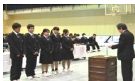
浜田瓦工場株式会社チーム (1年3組)