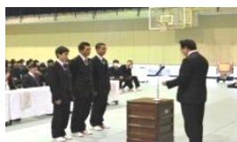
カジュアルレストラン 茶居夢チーム(1年2組)