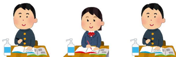
生徒一人一人に本人用の消毒液を配布