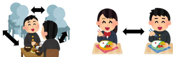
距離を置き、対面にならない対策