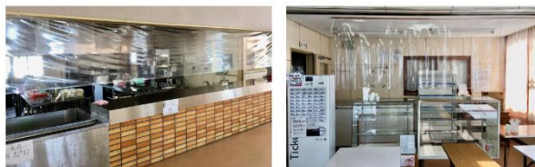
販売所に飛沫防止シートを設置