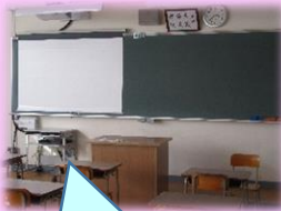
教室に設置されたICT機器