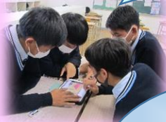
タブレットの活用