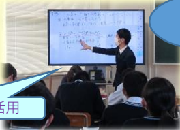
まなボードの活用