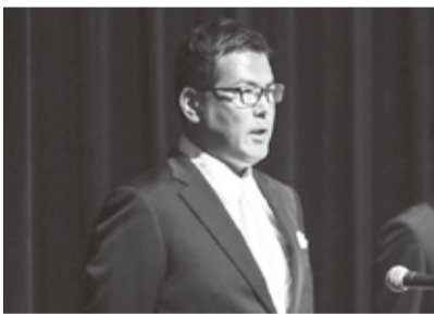
司会(藤木先生・高51回)